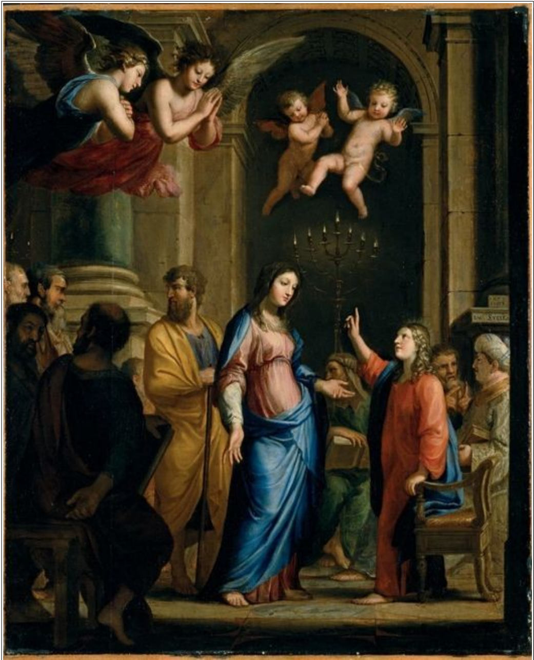
Jésus retrouvé au Temple par ses parents - musée des Beaux-Arts de Lyon