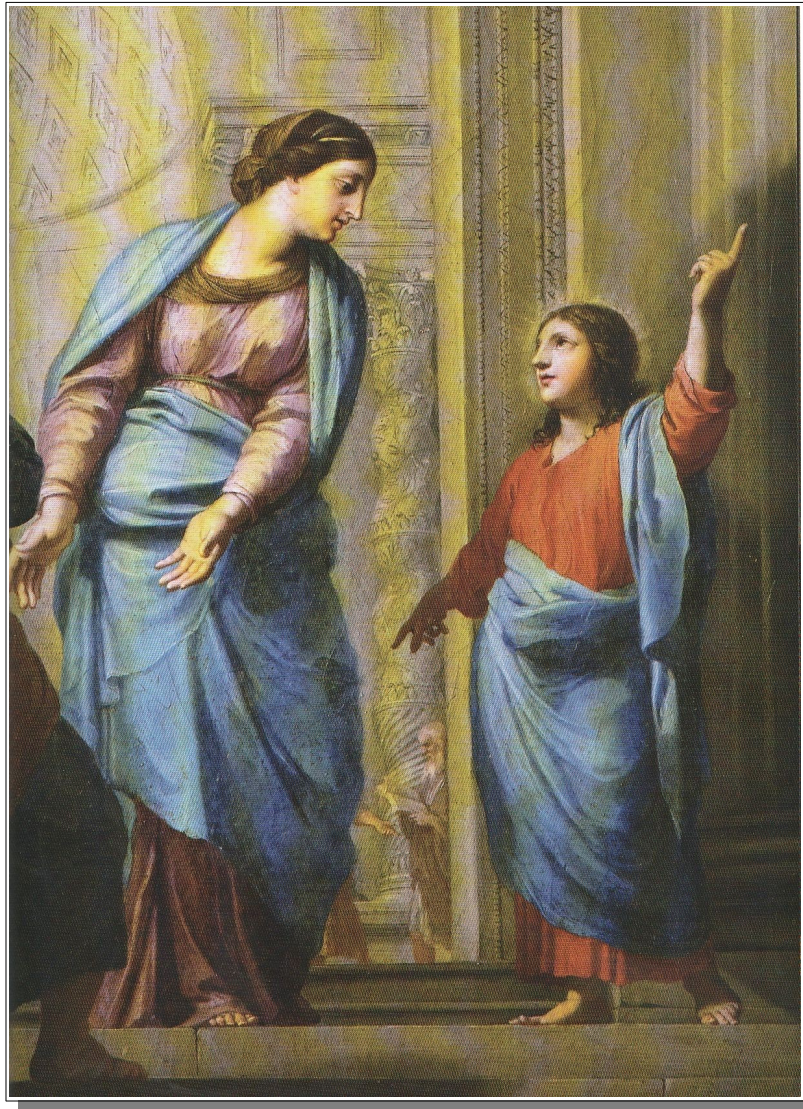
Détail du tableau de Fos

Revenons sur l'historique du tableau de Fos. Il fut légué par Modeste Doniez (maire de Fos de 1816 à 1830 puis de 1848 à 1851), né à Fos en