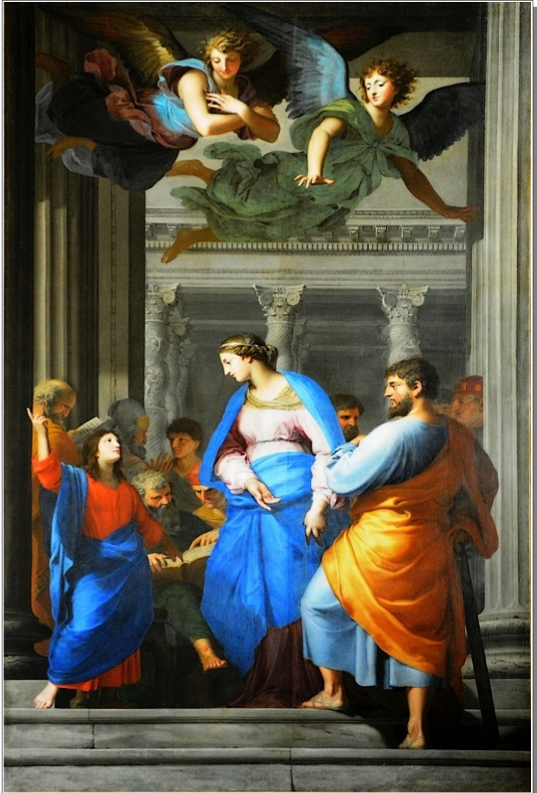
Jésus retrouvé au Temple par ses parents - église Notre-Dame - Les Andelys