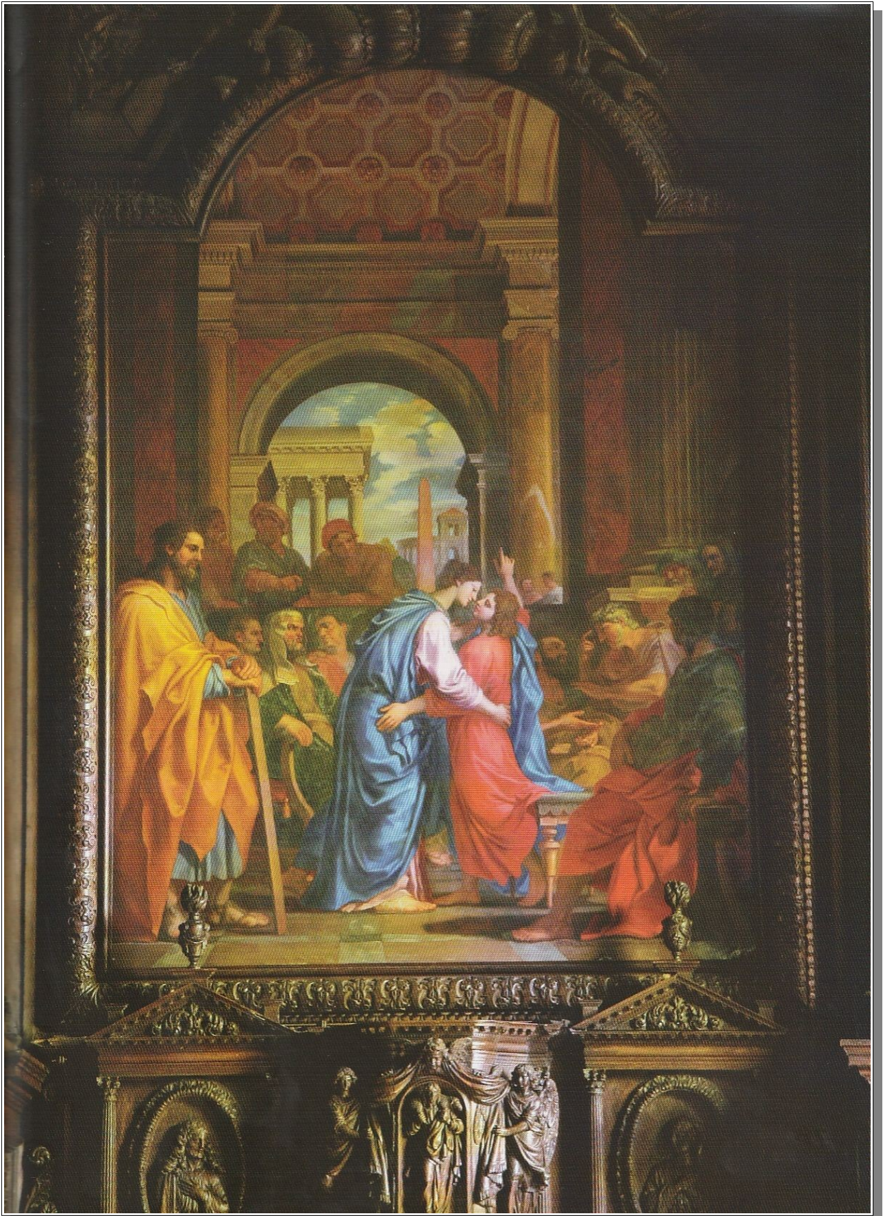
Jésus retrouvé au Temple par ses parents - église Sainte-Ayoul - Provins