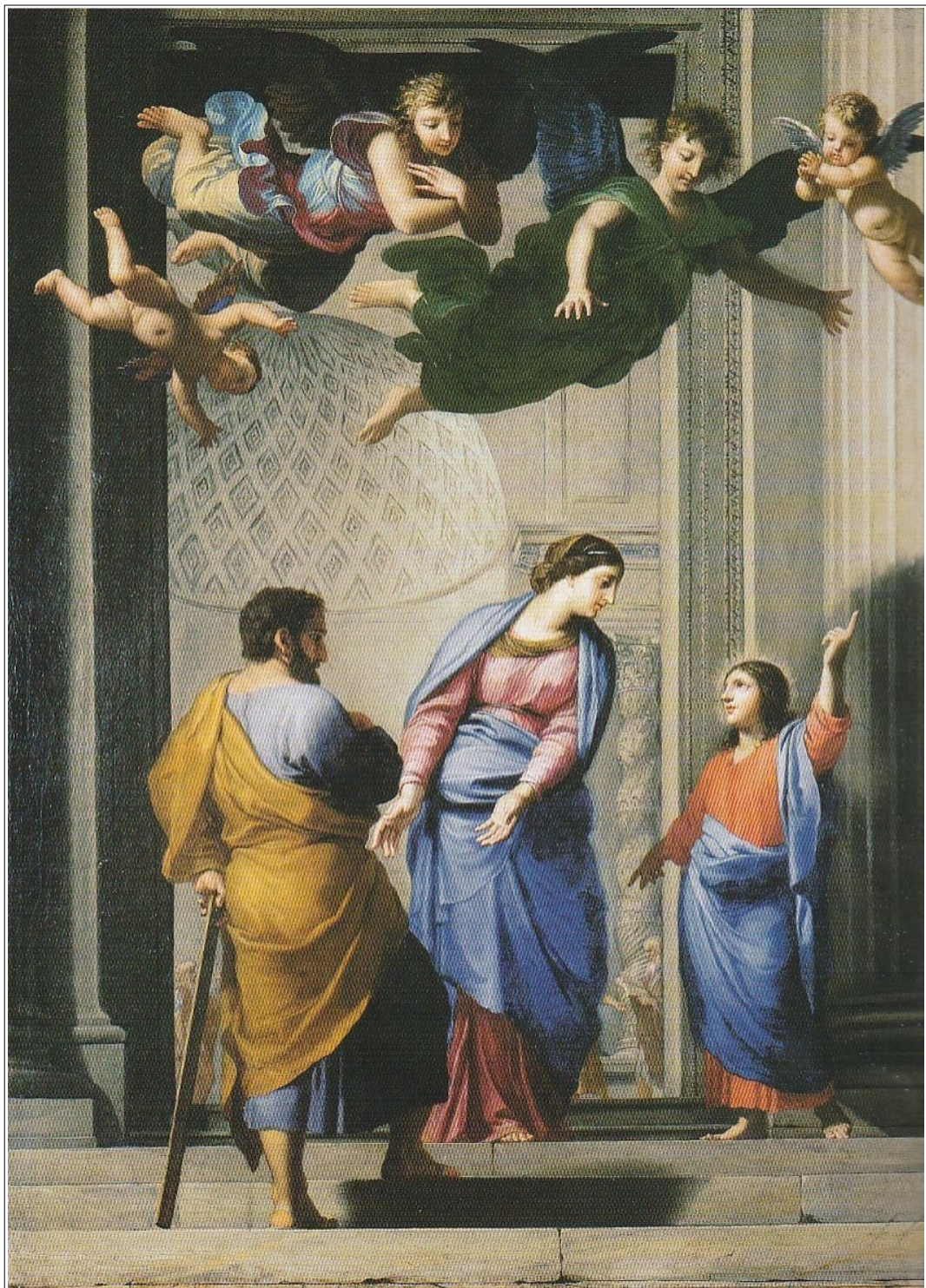
Jésus retrouvé au Temple par ses parents - église Saint-Pierre-aux-Liens - Fos