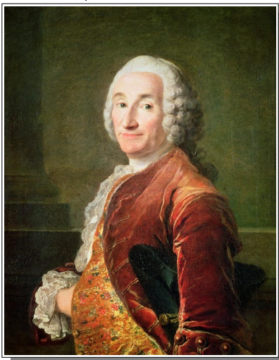
Louis-François-Armand de Vignerot du Plessis, duc de Richelieu, gouverneur de Guyenne